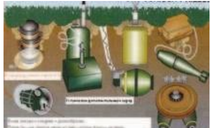
Замаскована міна-пастка у м'ячі, пачці з-під цигарок і основні види мінування. Зона можливого ураження в радіусі 150 м