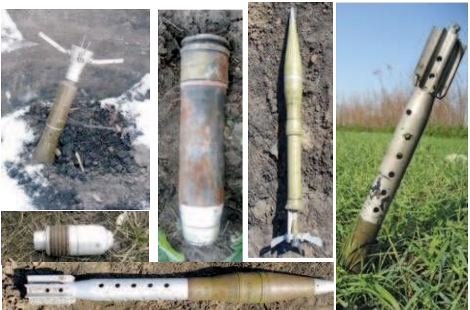
Постріли з гранатометів